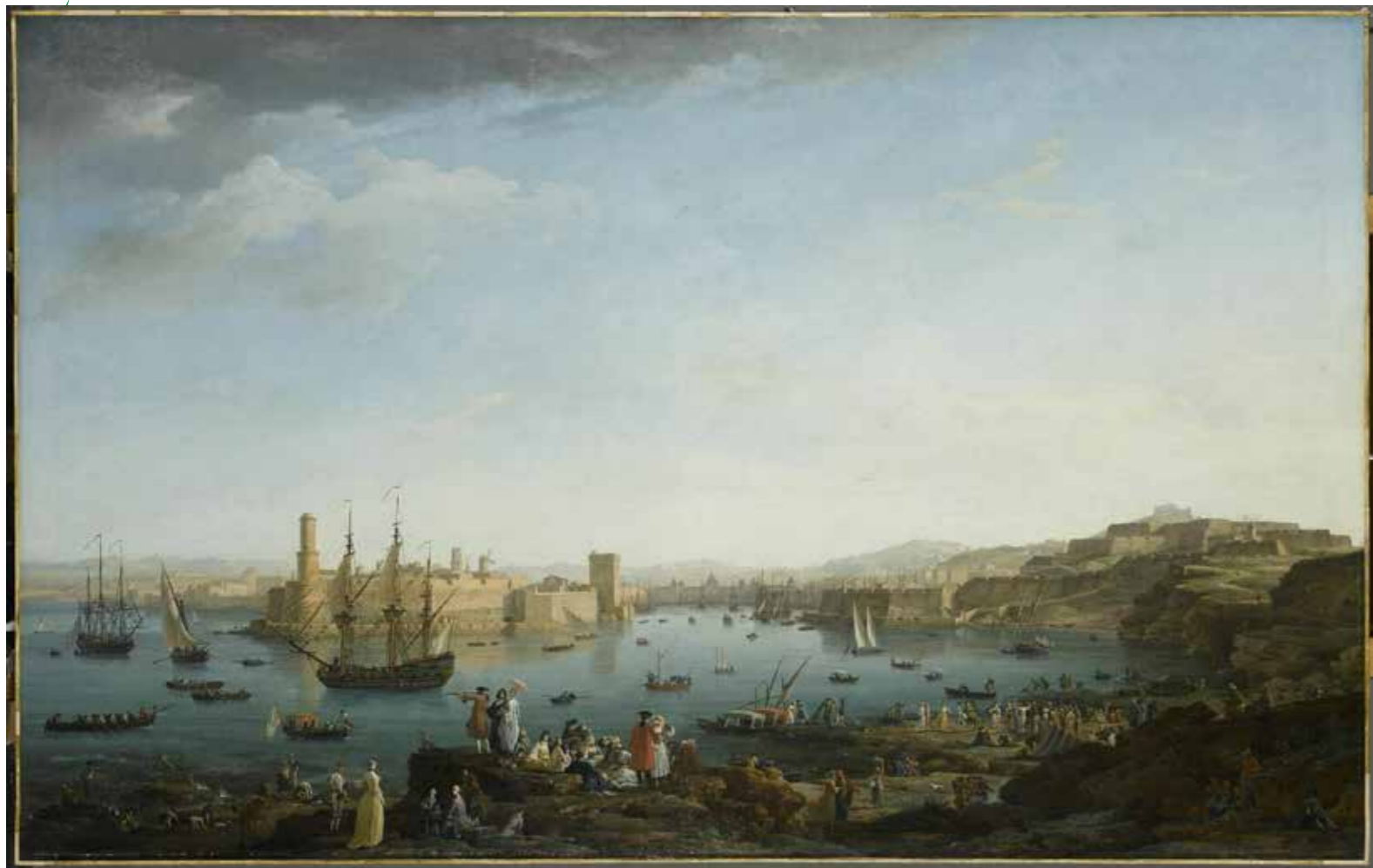
In alto: A C. J. Vernet, Vues des ports de France, L'Entrée du port de Marseille, 1754, Paris, Musée de la Marine, Musée du Louvre, Département des Peintures; sotto: Charles François Grenier de Lacroix, detto Lacroix de Marseille, Pêcheurs à la tombée du jour, 1768 Pagina di destra in alto: G. Drury, Classic Racing Yachts of the Needles, collezione privata . In basso: W.J. Huggins, The opium ships et lintin, Cina, olio su tela, 1824, Collezione privata