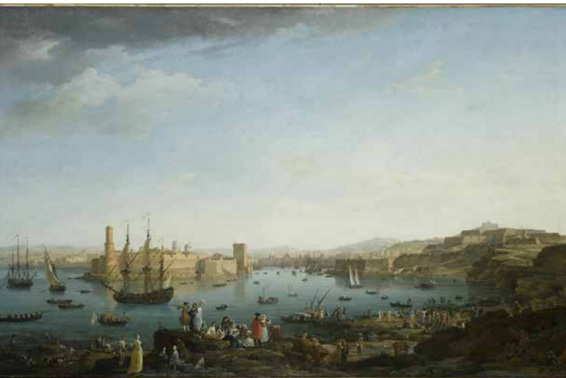
In alto: A. C. J. Vernet, Vues des ports de France, L'Entrée du port de Marseille, 1754, Paris, Musée de la Marine, Musée du Louvre, Département des Peintures; sotto: Charles François Grenier de Lacroix, detto Lacroix de Marseille, Pêcheurs à la tombée du jour, 1768 Pagina di destra in alto : G. Drury, Classic Racing Yachts of the Needles, collezione privata . In basso : W.J. Huggins, The opium ships et lintin, Cina, olio su tela, 1824, Collezione privata