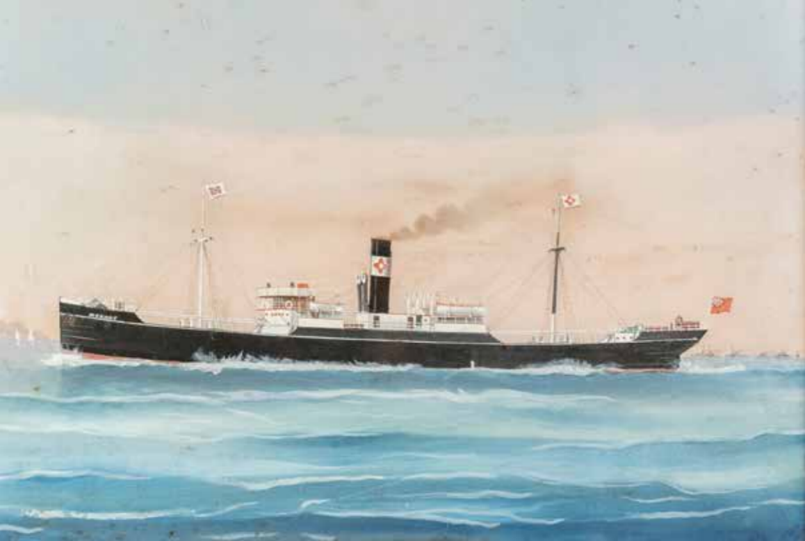
Sopra, la nave a vapore Mozart in mare calmo, gouache su carta, 1890 circa, 59,5x40 cm. Qui accanto: Jacopo Zucchi (c. 1542 – 1596), Trionfo di Nettuno, olio su tela, 39 x 61 cm. A destra: la Nave a vapore Mozart in mare calmo, Gouache su carta, 1890 ca., 59,5x40 cm. in basso la copertina del libro Sognare il mare cui è dedicato questo articolo