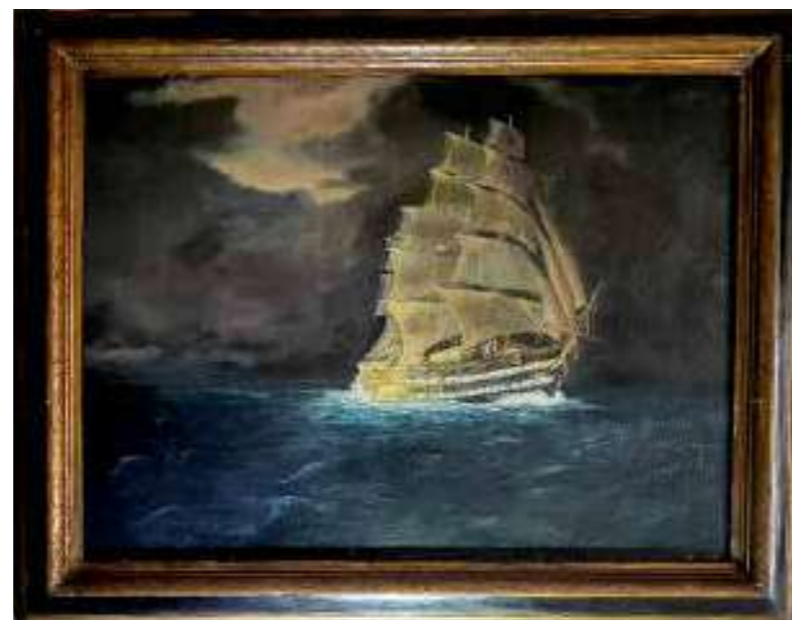
A sinistra un'immagine della raccolta di stampe a soggetto marinaro nella Villa Medici Giulini. Qui sopra: Vascello Vespucci, olio su tela 1960 ca. Collezione privata. Qui sotto: Il cantiere di Castellamare di Stabia, Museo della Reggia di Caserta. Pagina accanto: C.J.Vernet, Vista del Golfo di Napoli, olio su tela, 1748 Museo del Louvre. In basso: Marcantonio Franceschini (1648-1729), Trionfo di Galatea, olio su tela, cm 49,5 x 59