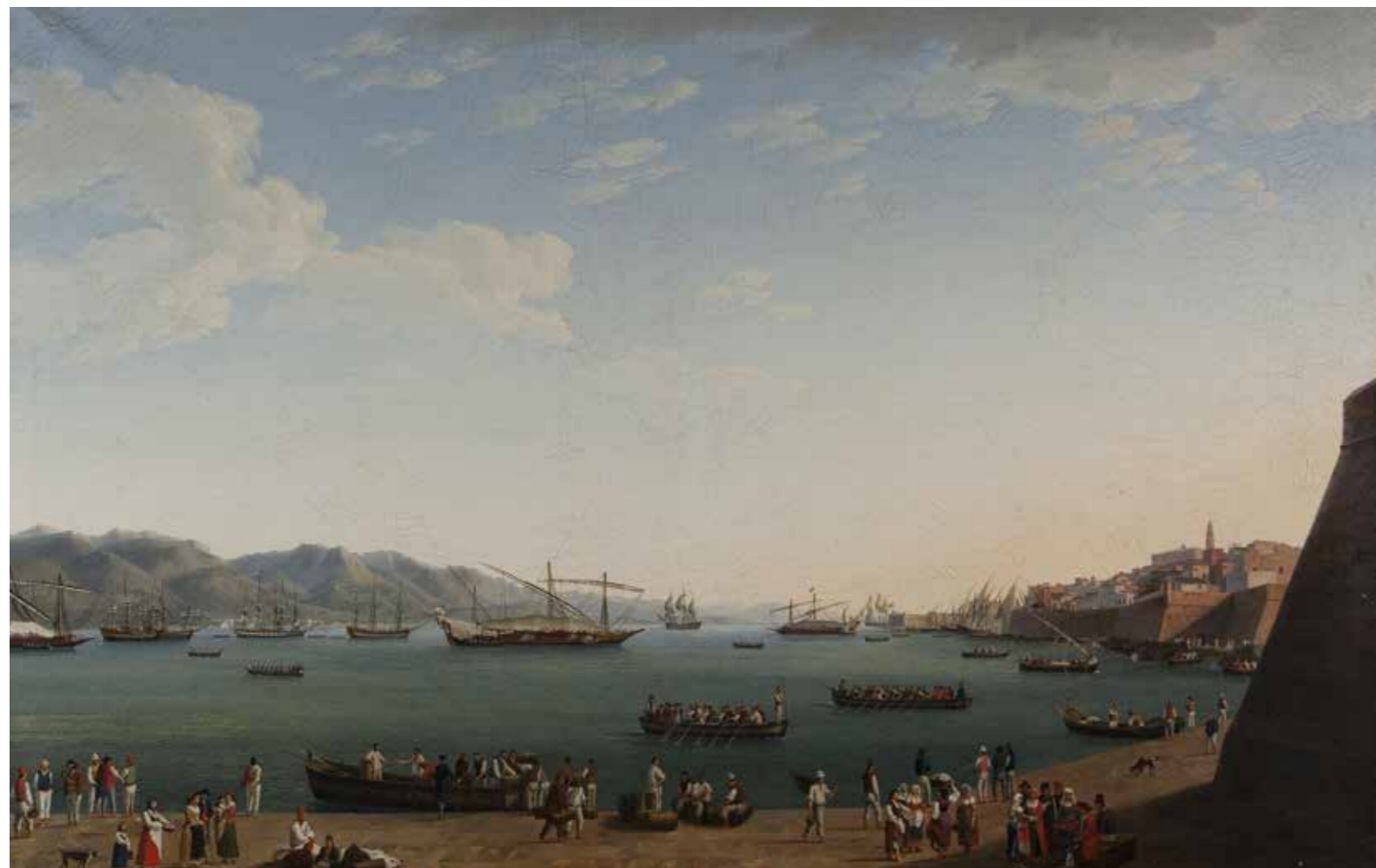
Qui sopra: Porto e Badia di Gaeta. In basso, Veduta di Mola di Gaeta, e in distanza della Città di Gaeta con la sua Fortezza e Rada, Museo della Reggia di Caserta. Pagina accanto: in alto, Il Cantiere di Castellammare di Stabia nel momento che si varava il Vascello detto la Partenope, addì 16 Agosto 1786. In basso: Veduta di Mola di Gaeta, Museo della Reggia di Caserta