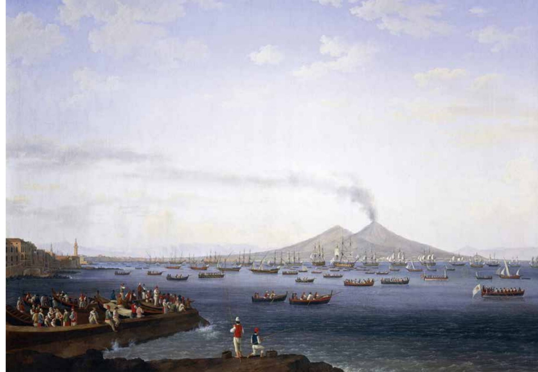
A sinistra: Jacopo Zucchi (c. 1542 – 1596), Trionfo di Nettuno, olio su tela, 39 x 61 cm. In alto: La rada di Napoli presa da S. Lucia, con la Squadra di S.M. tornata da Algeri ed ancorata quivi nel dì 1 Settembre 1784, Museo della Reggia di Caserta. In basso a destra la copertina del libro Sognare il mare da cui è tratto questo articolo